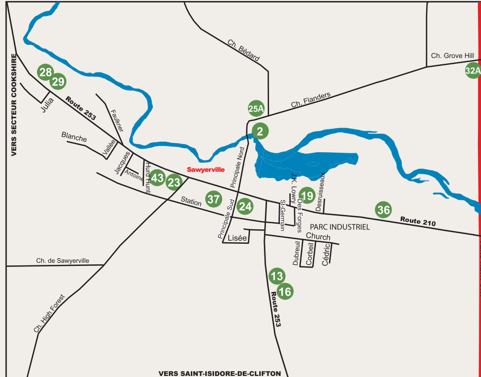
Secteur Sawyerville District