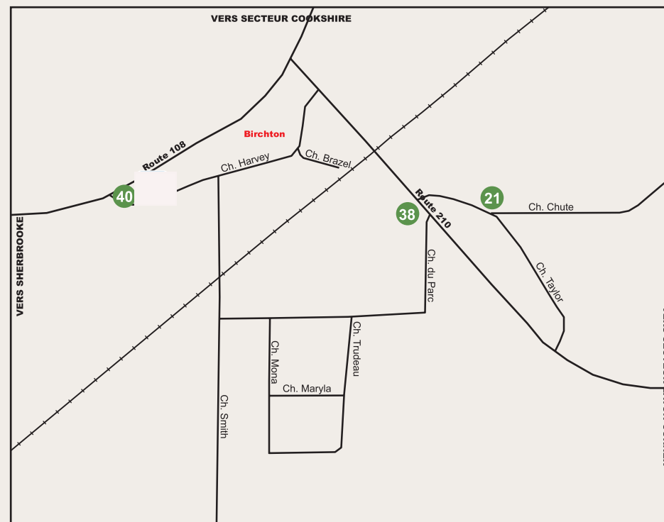
Secteur Birchton District